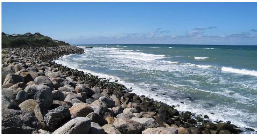
Kystsikring ved Harerenden i Lønstrup.

– Men vi vil ændre loven, så kystbeskyttelsesprojekter, der skal beskytte mange grundejere på én gang, ikke bliver væsentlig forsinket som følge af klager. Borgere skal ikke leve i frygt for oversvømmelser. Vi står over for klimaforandringer, der kun gør det endnu vigtigere, at kommunerne effektivt kan forebygge de negative konsekvenser af klimaforandringerne, siger miljøministeren.